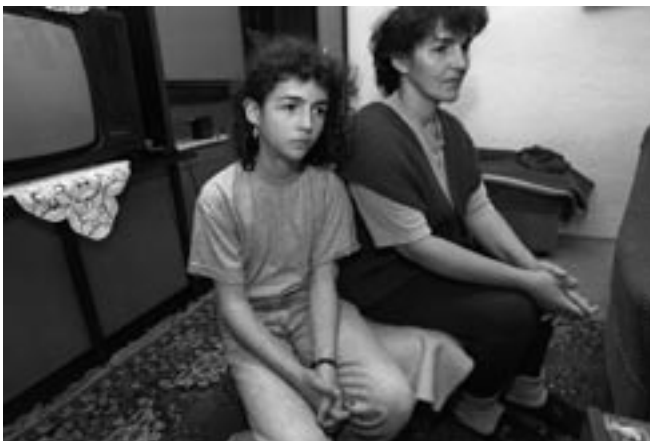
Die Fotos entstanden im November 1995 im Kosovo. Sie zeigen die kriegsbedingten Verletzungen eines Mädchens.