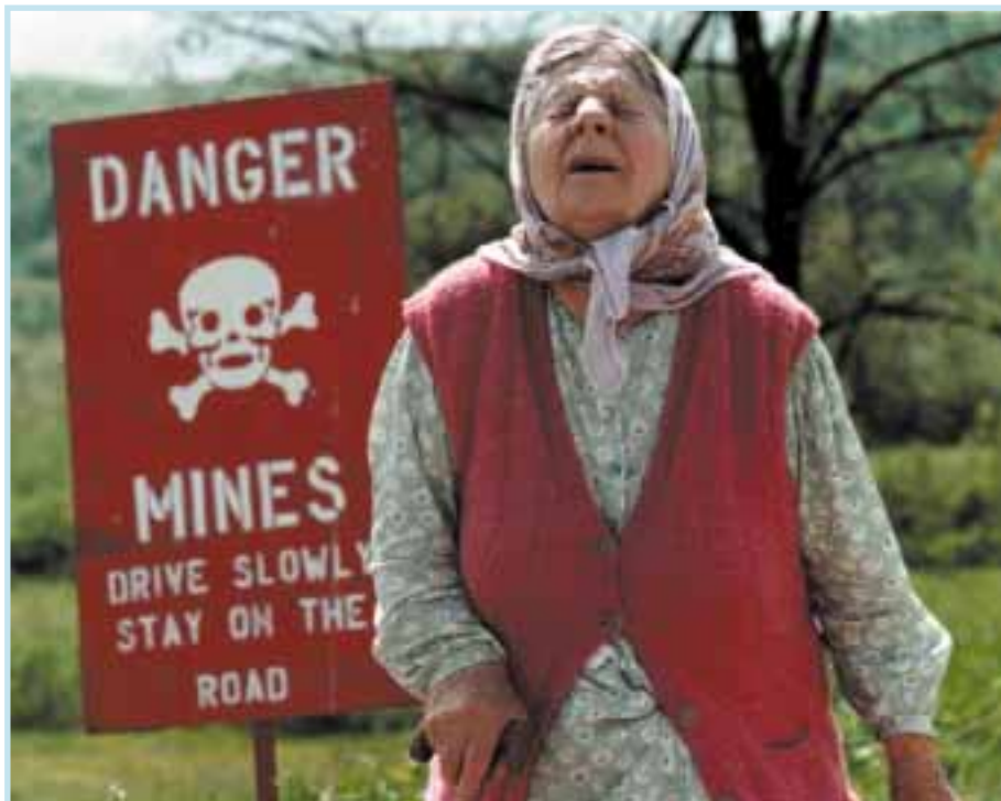
EINE ÄLTERE MOSLEMISCHE FRAU MACHT IN DER NÄHE EINES MINEN-WARNSCHILDES AN DER STRASSE NACH STANIC RIJEKA (50 KM WESTLICH VON TUZLA) EINE KURZE PAUSE UND ATMET TIEF DURCH. IN DER UMGEBUNG DES DORFES VERLIEF DIE FRONTLINIE ZWISCHEN SERBEN UND MOSLEMS. UNTER DEM EINDRUCK DES KRIEGES IM EHEMALIGEN JUGOSLAWIEN SCHWANDEN DIE HOFFNUNGEN AUF EINE WELTWEITE „FRIEDENSDIVIDENDE“ NACH DEM ENDE DES OST-WEST-KONFLIKTES.