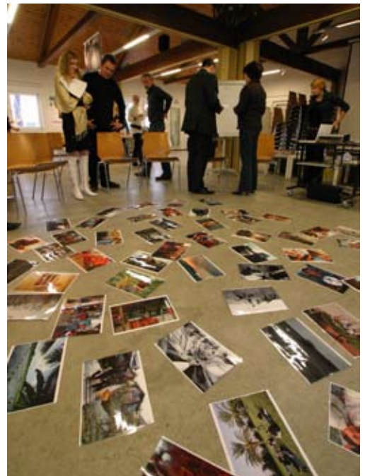
Fotos der Ausstellung „Peacebuilders Around the World“ werden bei den Workshops als Materialien verwendet.

andersetzungen zu erweitern und den Blick für neue Handlungs- und Lösungsansätze zu schärfen. Als Ansatz wird die Auseinandersetzung mit Best Practice-Beispielen erfolgreicher Konfliktbearbeitung und Friedensstiftung in unterschiedlichen Konfliktregionen der Welt gewählt. Die vom Peace Counts project recherchierten und veröffentlichten und vom Institut für Friedenspädagogik didaktisch aufbereiteten Beispiele stehen hierbei im Zentrum. Entwickelt wurde ein bereits in mehreren Ländern erfolgreich erprobtes Veranstaltungs- und Lernarrangement aus Ausstellung und Workshops. Bisherige Stationen von „Peace Counts on Tour“ waren in den Jahren 2007 und 2008 Colombo (Sri Lanka), Skopje (Mazedonien), Abidjan (Côte d’Ivoire) und Mindanao (Philippinen). ( www.peace-counts.org ; www.friedenspaedagogik.de )