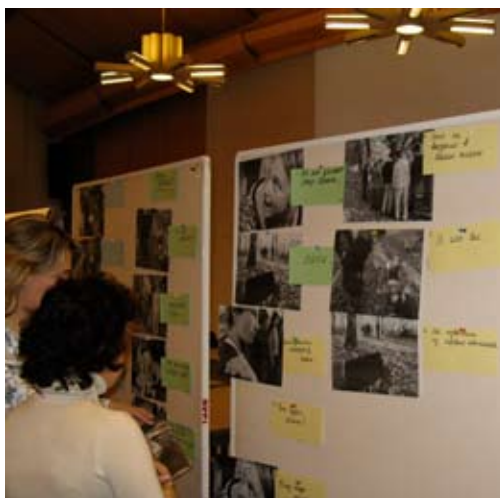
„Konfliktgeschichten“: Seminar in Pinneberg mit Lehrerinnen und Lehrern aus Selenogradsk.

Weise notwendig sei, die auf Versöhnung und Verständigung gerichtete Partnerschaftsarbeit mit russischen Akteuren durch explizit friedenspolitische und –pädagogische Komponenten zu bereichern und zu stärken. Angesichts der langjährigen Zusammenarbeit, die das SCHIFF mit dem Institut für Friedenspädagogik Tübingen verbindet, wurde dort angefragt, ob man sich vorstellen könne, dass das vom ift mitgetragene Projekt „Peace Counts on Tour“ auch in Kaliningrad Station machen könne.