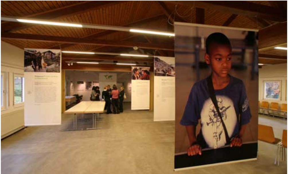
Nähe und Rückbezug: Das DRH bietet Platz für Ausstellung und Workshops.