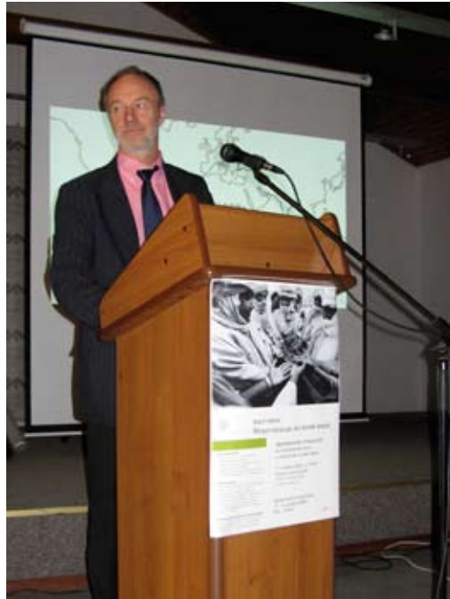
... und Manne Wängborg, der schwedische Generalkonsul in der russischen Exklave.