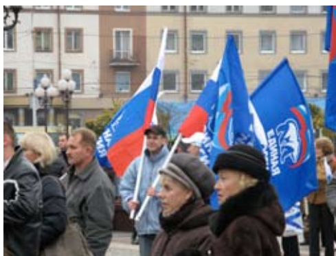
Anhänger der Partei „Einiges Russland“ betonen beim Nationalfeiertag ihre Zugehörigkeit zum Kernland.

Die Oblast Kaliningrad, ein Subjekt der Russischen Föderation, ist keine Krisen- und erst recht keine Kriegsregion. Das Gebiet zeichnet sich jedoch durch seine spezifische Geschichte als Teil des früheren deutschen Ostpreußens und durch seine besondere politisch-geographische Situation (russische Exklave bzw. Enklave von EU und NATO) aus. In der Friedens- und Konfliktforschung hat das Gebiet erhöhte Aufmerksamkeit als Modellfall für Konfliktprävention erlangt. Das kleine Gebiet liegt im Schnittpunkt der beiden großen Pole europäischer Entwicklung, Russland und der EU, und hat einen hohen friedenspolitischen Stellenwert. Der Transformationscharakter des Gebietes und die damit verbundenen individuellen und gesellschaftlichen Herausforderungen erfordern und ermöglichen es, gemeinsame Interessen und Werte zu festigen und den Austausch über unterschiedliche, aber doch ähnliche Erfahrungen im Umgang mit alltäglichen Konflikten und die Entwicklung einer gemeinsamen Perspektive auf das Leben der Menschen in weltpolitischen Krisengebieten zu fördern.