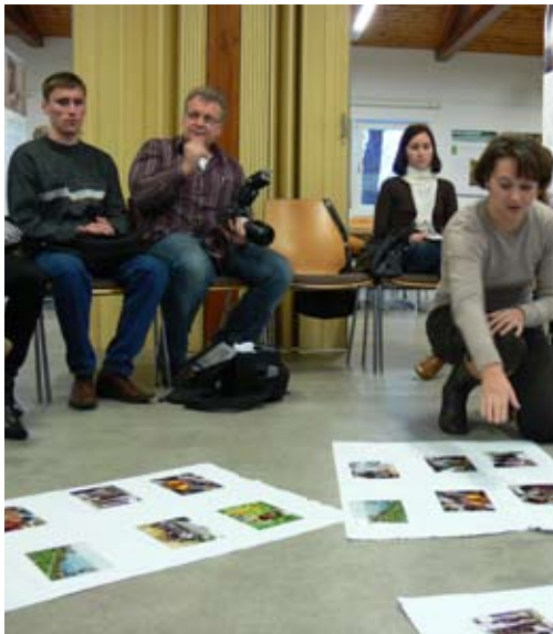
Simulation einer Redaktionskonferenz.