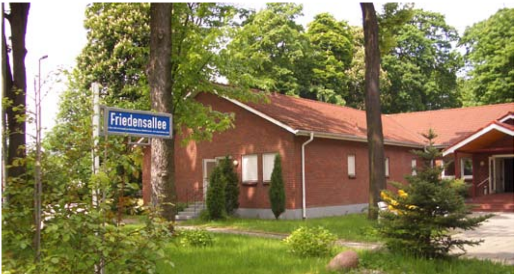
Das Deutsch-Russische Haus in Kaliningrad (DRH) – ein geeigneter Ort für Ausstellung und Workshops.