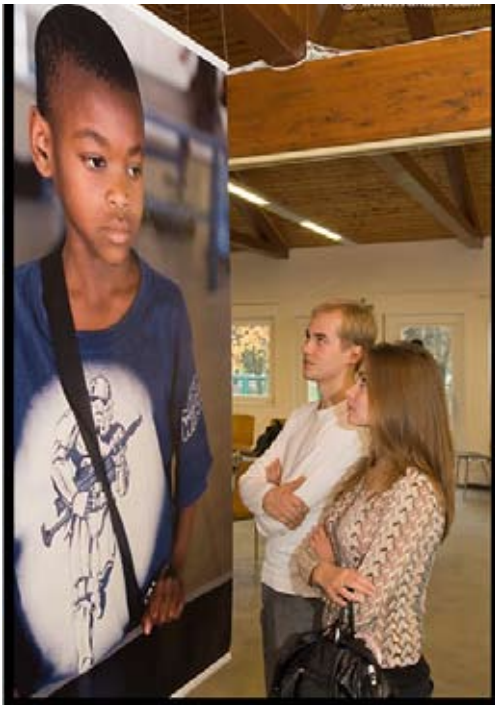
Beeindruckendes Foto: Junge aus Rio de Janeiro.