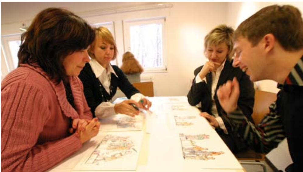
Russische Pädagoginnen und Pädagogen üben „Streitkultur“.

und Inspiration für eine weitere Auseinandersetzung. Die Nachhaltigkeit von „Peace Counts on Tour“ im allgemeinen und der Station „Kaliningrad“ im besonderen wird sich daran zu messen haben, ob es gelingt, Kontakt zu halten, Netzwerke zu bilden und weitere Kooperationen zu beschließen. Beispiele aus der Vergangenheit machen Mut: So findet „Peace Counts on Tour“ in Abidjan im kommenden Jahr seine Fortsetzung mit einem neuen Journalisten-Projekt (lokale Journalisten werden betreut und schreiben Peace Counts-Reportagen aus Cote d'Ivoire); Berichte aus Sri Lanka zeigen, dass die Materialien in Schule und interethnischer Jugendarbeit immer intensiver verwendet werden; aus Mindanao wird berichtet, dass das in Vorbereitung der Station entstandene lokale Netzwerk von NGOs, Kommune und unterschiedlichen Konfliktparteien die jüngsten blutigen Unruhen auf der philippinischen Insel zum Anlass für neue gemeinsame Aktivitäten nimmt.