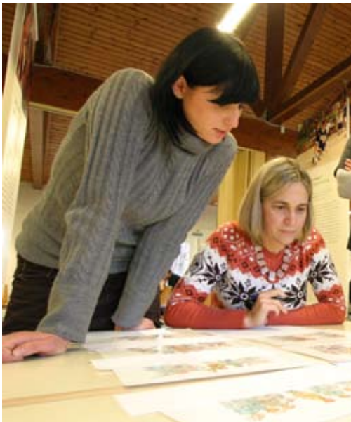
„Wie Konflikte eskalieren“: Kolleginnen von „Freedom of Speech“ bei der Workshoparbeit.

1. Nach einer knappen Einführung und einer Vorstellungsrunde der Teilnehmerinnen und Teilnehmer standen Erfahrungen mit der Eskalation und Deeskalation von Konflikten im Zentrum des ersten Moduls. Zentrales Medium war die „Bilderbox Streitkultur“ des Instituts für Friedenspädagogik, mit den Plakaten „Neun Stufen der Konflikteskalation“ von Friedrich Glasl, „Konfliktlösung“ und „Versöhnung“. Die Poster lagen in russischer Sprache vor. Für viele Teilnehmerinnen und Teilnehmer war es ungewohnt, gleich zu Beginn eines Workshops in Arbeitsgruppen zu arbeiten. Fast alle hatten mit einem oder mehreren Vorträgen gerechnet. Doch alle Gruppen waren mit großem Interesse und wachsender Begeisterung dabei, mit Hilfe dieses Mediums Konflikte aus der eigenen Erfahrungswelt zu besprechen und zu erhellen.