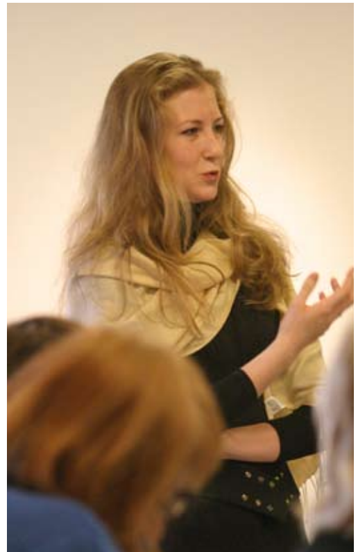
Offene Diskussionen prägten das Klima in den Workshops.

4. Das Modul „Best Practice: Beispiele für Friedensstiftung“ rundete den Workshop ab und richtete das Augenmerk mehr auf die politische und internationale Dimension des Friedens. Auf großes Interesse stieß dabei die Reportage über