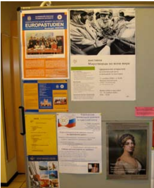
Ankündigungsplakat im Foyer des DRH.

grassiert Alkoholismus, herrscht Gewalt. Nur in den schlimmsten Fällen, wenn die Familie für das Kind zur Lebensgefahr wird, entziehen die Sozialämter den Eltern das Sorgerecht und bringen die Kinder in einem Heim unter.“ Hilfsprojekte, die auch von Deutschland aus unterstützt werden, kümmern sich um die hohe Zahl von Straßenkindern in Kaliningrad. Verwahrlosung und häusliche Gewalt stellen nicht nur die Mitarbeiterinnen und Mitarbeiter der sozialen Einrichtungen vor große Probleme, sondern auch das Lehrpersonal an Schulen. Dieser Sachverhalt und die fehlenden Plattformen für den Erfahrungsaustausch im Umgang mit Konflikt- und Gewaltpotenzialen machten Kaliningrad als Station von „Peace Counts on Tour“ zu einer besonderen friedenspädagogischen Herausforderung.