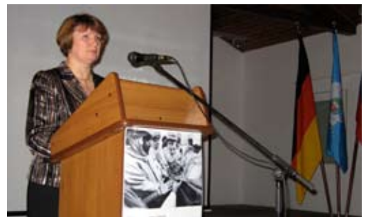
Irina F. Werschinina, Ombudsfrau der Oblast Kaliningrad.